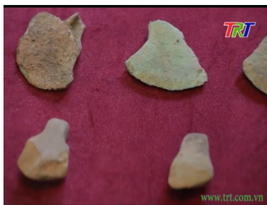
Hình 1. Một số hình ảnh của người nguyên thủy ở Thừa Thiên Huế

( https://www.youtube.com/watch?v=R217pOtqqR0 )